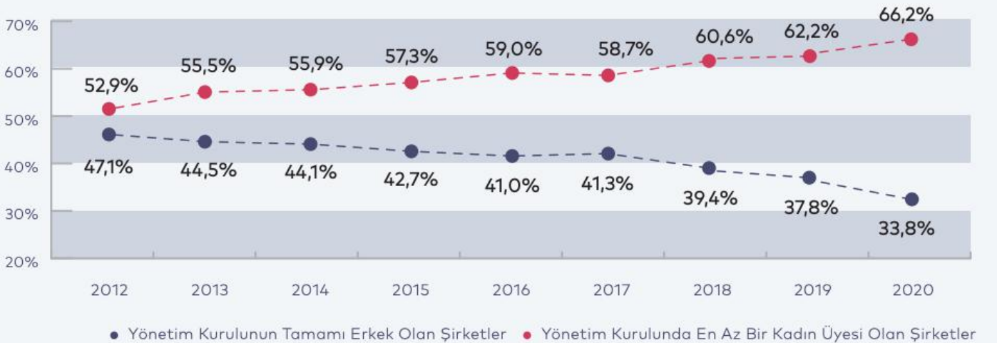
Yıllar İtibarıyla Yönetim Kurullarında Kadın Üye Olan/Olmayan BIST Şirketleri (2012-2020)

2012-2020 yılları arasında yönetim kurullarında en az bir kadın üyesi olan şirketlerin oranında 2019 yılında olduğu gibi yavaş ama olumlu bir değişim gerçekleşti, 2020 yılında yönetim kurullarının tamamı erkek olan şirketlerin oranı %33,8'e düştü.