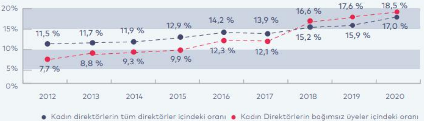
Yıllar İtibarıyla BIST Şirketleri Yönetim Kurullarındaki Kadın Üye ve Bağımsız Üyeler Arasında Kadın Üye Oranı (2012-2020)

2020 yılında hem yönetim kurullarındaki toplam üyeler arasında, hem de bağımsız yönetim kurulu üyeleri arasında kadın üye oranı artış gösterdi. Bağımsız yönetim kurulu üyeleri arasındaki kadınların oranı toplamdaki kadın üye oranını geçerek %18,5'e yükseldi.